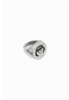
Anillo de la colección GOOD

Como podría intuirse llegados a este punto, LAF nació en los despachos de una consultoría de marketing. La idea de crear una firma de bisutería a partir de muñecos de Playmobil nació al son de ese movimiento sociocultural nostálgico que hitos como el 50 aniversario de Televisión Española y la serie Cuéntame como Pasó, en el caso de los más veteranos, y «La hora chanante» y la conmemoración del Mundial 82 y la Movida, para los más jóvenes, extendieron por todo el país.