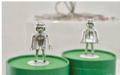
Parte de la colección http://lifeislaf.com/es/13-playmobil http://lifeislaf.tumblr.com/

Hoy, casi 40 años después del nacimiento de los venerados clics, una empresa española ha decidido recuperar esos pequeños juguetes de culto para convertirlos en una línea de bisutería vintage.