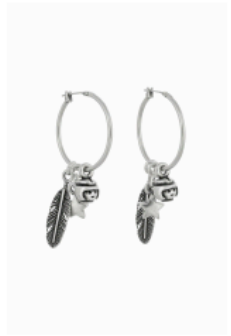
Pendientes de la colección Aires

Como podría intuirse llegados a este punto, LAF nació en los despachos de una consultoría de marketing. La idea de crear una firma de bisutería a partir de muñecos de Playmobil nació al son de ese movimiento sociocultural nostálgico que hitos como el 50 aniversario de Televisión Española y la serie Cuéntame como Pasó, en el caso de los más veteranos, y «La hora chanante» y la conmemoración del Mundial 82 y la Movida, para los más jóvenes, extendieron por todo el país.