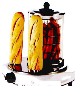
Maquina de perritos calientes, de Domoclip para Curiosite, 79,90€ (www.curiosite.es).