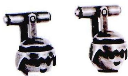
Gemelos inspirados en los Click de Playmobil de LAF, 70€ (tel. 902 372 272).