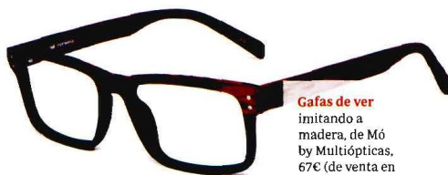
Gafas de ver imitando a madera, de Mó by Multiópticas, 67€ (de venta en Multiópticas).