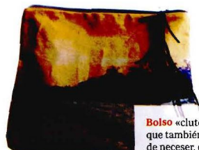
Bolso «clutch», que también sirve de neceser, de Zubi, 60€ (www.zubidesign.com).