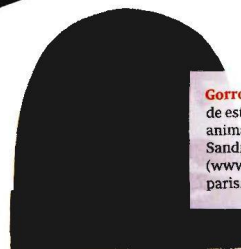
Gorro unisex de estampado animal de Sandro, 55€ (www.sandro-paris.com).