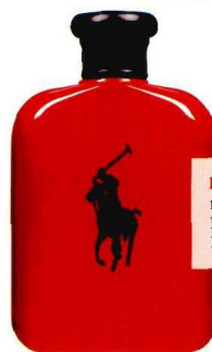
Fragancia masculina Polo Red, de Ralph Lauren, 56€.