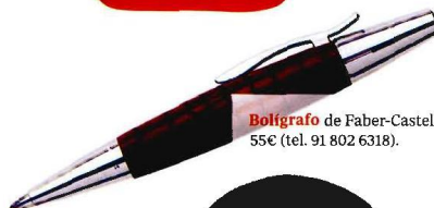
Boligrafo de Faber-Castell, 55€ (tel. 91 802 6318).