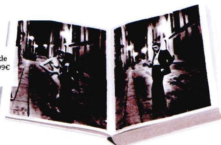
Libro de fotografías de Helmut Newton, 99,99€ (www.taschen.es).