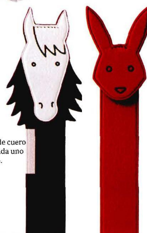
Marcapáginas de cuero de Loewe 95€ cada uno (tel. 91 204 1300).