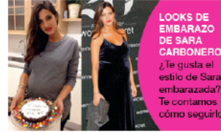
LOOKS DE EMBARAZO DE SARA CARBONERO ¿Te gusta el estilo de Sara embarazada? Te contamos cómo seguirlo