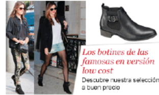
Los botines de las famosas en versión low cost Descubre nuestra selección a buen precio