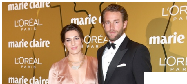
Eugenia Ortiz en los Premios Prix de la Moda de Marie Claire 2012