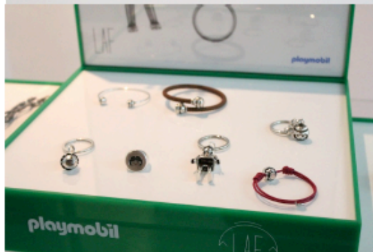
( http://www.it-girl.es/wp-content/uploads/2013/10/IMG_1750.jpg )