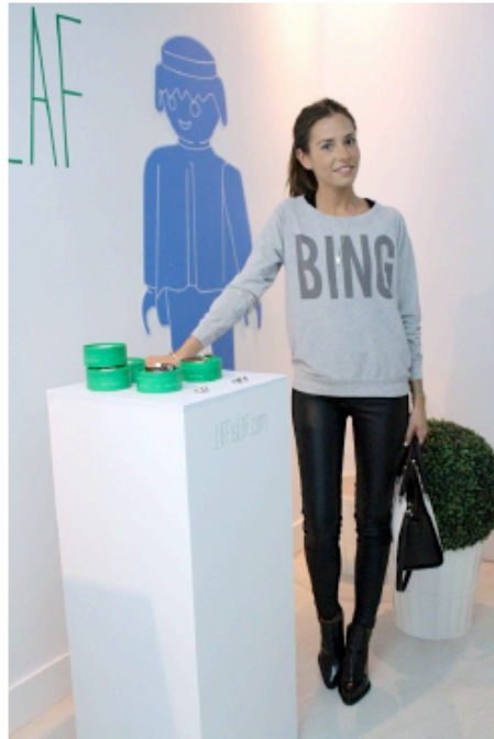
( http://www.it-girl.es/wp-content/uploads/2013/10/IMG_1796.jpg )