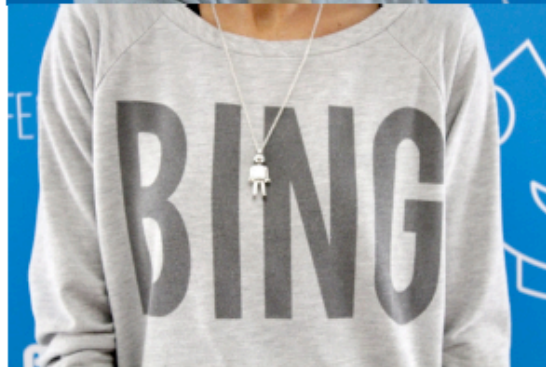
( http://www.it-girl.es/wp-content/uploads/2013/10/IMG_1760.jpg )