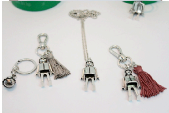
( http://www.it-girl.es/wp-content/uploads/2013/10/IMG_1744.jpg )