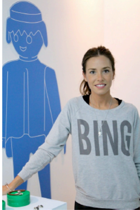
( http://www.it-girl.es/wp-content/uploads/2013/10/IMG_1797.jpg )