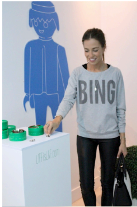
( http://www.it-girl.es/wp-content/uploads/2013/10/IMG_1764.jpg )