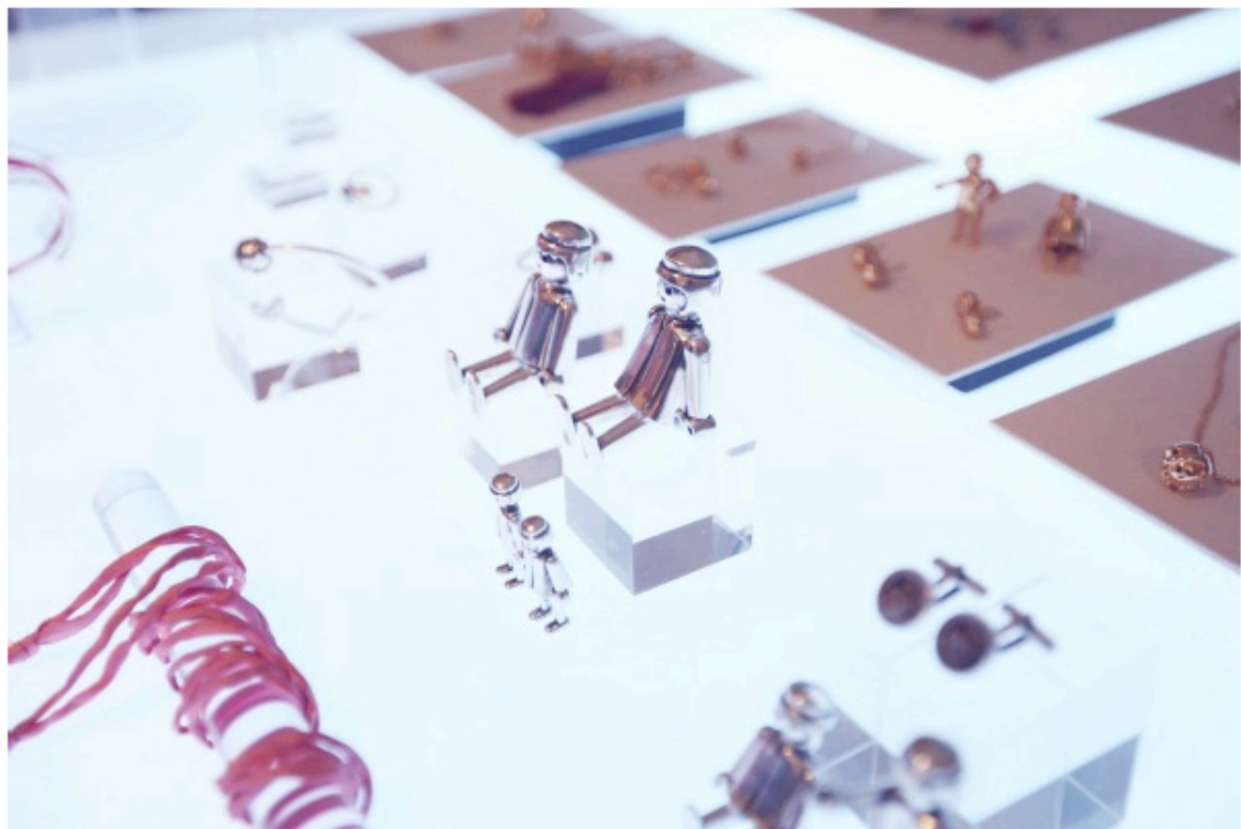
Laf para Playmobil